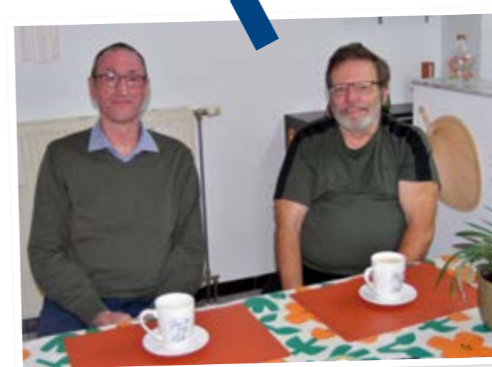
Babbelen bij een lekker tasje koffie.